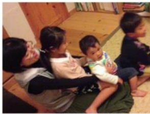
※親子わらべうたの様子

わらべうたは親子が一緒にうたって遊んでふれ合い、心がふんわり、ほっこりしてきます♡ 目には見えない大事なものがたくさんギュッと詰まっていますよ。