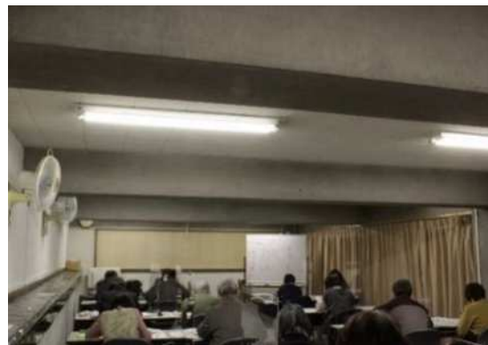
↑ 古文書講座の様子 実践編コース1