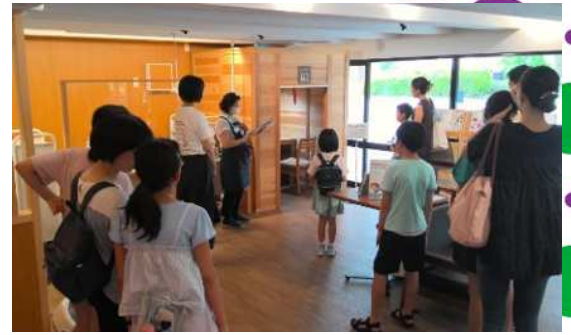
みんなの森 見学の様子

まずは、読書バリアフリーの部屋・みんなの森を見学！その後、点字の書き方を学びました。参加者のみなさんは、点字の名刺を作成し、“あいさが”の方に声に出して、確認してもらいました！完成した名刺を手に、みなさん笑顔になっていました。参加されたみなさん、ありがとうございました！