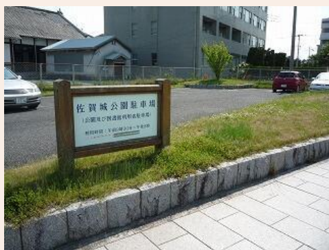
県庁南側 佐賀城公園駐車場

令和6年11月～令和7年8月まで、県立図書館外壁その他改修工事を行っております。できるだけ公共交通機関をご利用の上、ご来館ください。