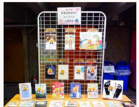
入賞作品対象図書の展示

今回もたくさんのご応募ありがとうございました。 県立図書館では3月に入賞作品の対象図書展示を行いました。 春になり、新生活がスタートする季節です。あわただしい毎日の中でも、少しだけ時間を作って、読書を楽しんでみませんか。