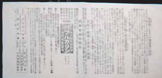
◆久本昌耀堂業広告