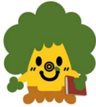
くすくすくん（県立図書館マスコット）

平成 26 年 10 月 31 日 佐賀県立図書館 企画・広報担当 担当者 高井 諸岡 内線 3711 / 直通 0952-24-2900 E-mail: saga-kentosyo@pref.saga.lg.jp