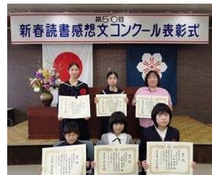
【参考：昨年度の知事賞受賞者】