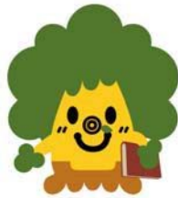
くすくすくん（県立図書館マスコット）

平成 27 年 10 月 23 日 佐賀県立図書館 企画・広報担当 担当者 高井 諸岡 内線 3711 / 直通 0952-24-2900 E-mail: saga-kentosyo@pref.saga.lg.jp