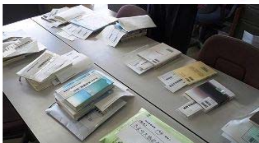
【『相互貸借』送り出し作業1】