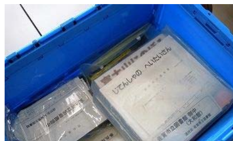
【『相互貸借』送り出し作業2】