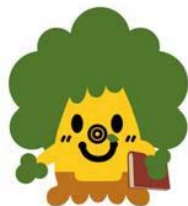
くすくすくん（県立図書館マスコット）

平成 28 年 4 月 28 日 佐賀県立図書館 企画・広報担当 担当者 西牟田 諸岡 直通 0952-24-2900 E-mail: saga-kentosyo@pref.saga.lg.jp