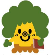
くすくすくん（県立図書館マスコット）

平成 28 年 10 月 28 日 佐賀県立図書館 企画・広報担当 担当者 西牟田、諸岡 直通 0952-24-2900 E-mail: saga-kentosyo@pref.saga.lg.jp