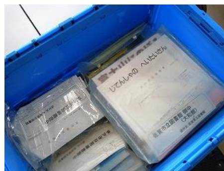
【『相互貸借』送り出し作業2】 各図書館別に封詰したものをコンテナに入れて発送。