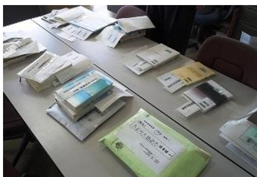
【『相互貸借』送り出し作業1】 各図書館から予約の入った本を取り置き、 図書館別に仕分ける。