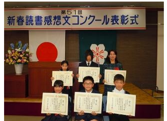
【参考：昨年度の知事賞受賞者】

イ より深く読書し、読書の感動を文章に表現することを通して、豊かな人間性や考える力を育む。さらに自分の考えを正しい日本語で表現する力を養う。