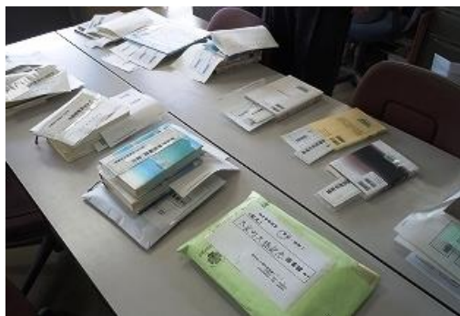
【『相互貸借』送り出し作業1】 各図書館から予約の入った本を取り置き、 図書館別に仕分ける。