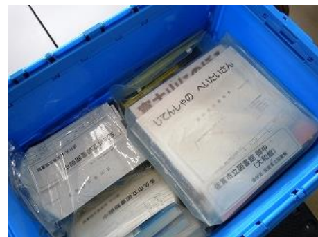
【『相互貸借』送り出し作業2】 各図書館別に封詰したものをコンテナ に入れて発送。