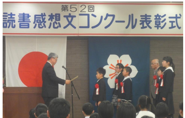
【昨年度の表彰式の様子】

イ より深く読書し、読書の感想を文章に表現することを通して、豊かな人間性や考える力を育む。さらに自分の考えを正しい日本語で表現する力を養う。