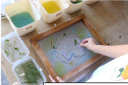
ワークショップ（イメージ）