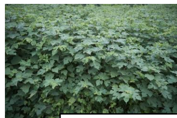
和紙の原料のカジノキ