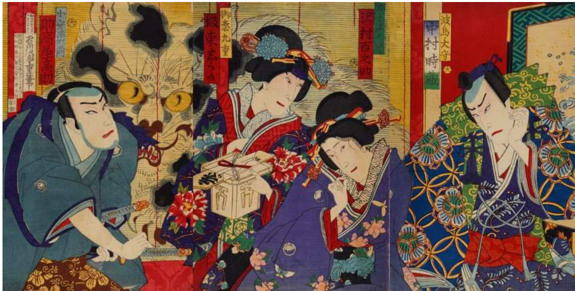
鍋島猫騒動の歌舞伎を描いた浮世絵 さがのおくようみょうきだん 【嵯峨奥妖猫奇談】 【初出品】 守川周重筆、明治13年（1880年）佐賀県立図書館蔵（図書館収集資料）

龍造寺隆信が自身没後の 領国統治方針を書き記した文書 龍造寺隆信遺言状 天正8年（1580年）頃か 武雄市蔵（武雄鍋島家資料） 武雄市重要文化財