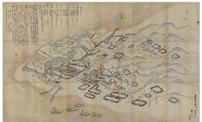
島原天草一揆における幕府軍・一揆軍の 配陣を示した絵図 はらじょうこうぼうず 原城攻防図 作者不詳、寛政元年(1789年) 佐賀県立図書館蔵 (図書館収集資料) ※佐賀県立名護屋城博物館にて展示